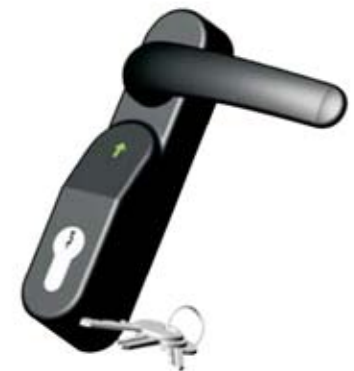
Cod. Art. BTA1095