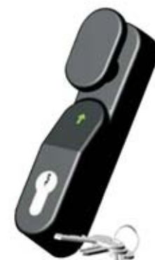
Cod. Art. BTA1095P